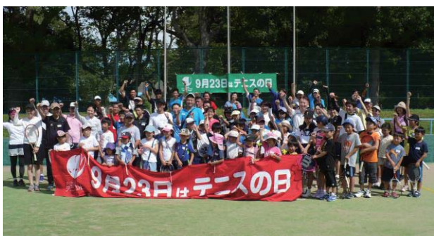
【千葉県 共同イベント】

100 万人ボレーボレー、TENNIS PLAY & STAY、エコ活動、親子テニス、キッズテニス、ジュニア及び一般対象のテニスクリニック、初心者対象レッスン、車イス交流テニス、有名選手コーチによるテニスクリニック、ターゲットテニス、テニスの日記念トーナメント、親善試合、アトラクション、他