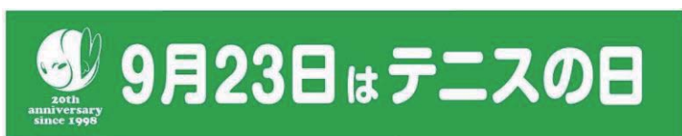
特大横断幕 【2017年送付済み】