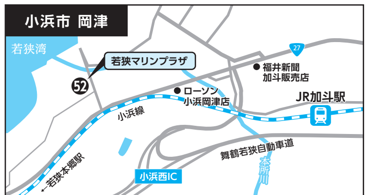
⑤⑫ 若狭マリンプラザ