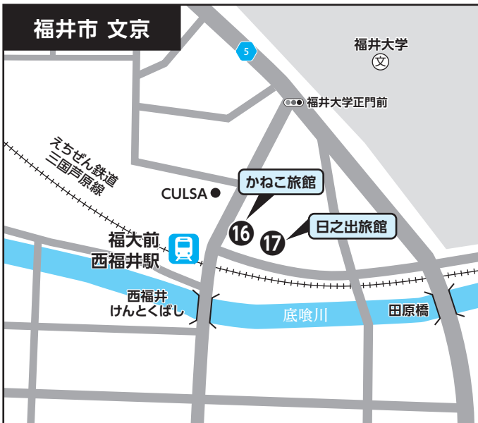
⑯ かねこ旅館 ⑰ 日之出旅館