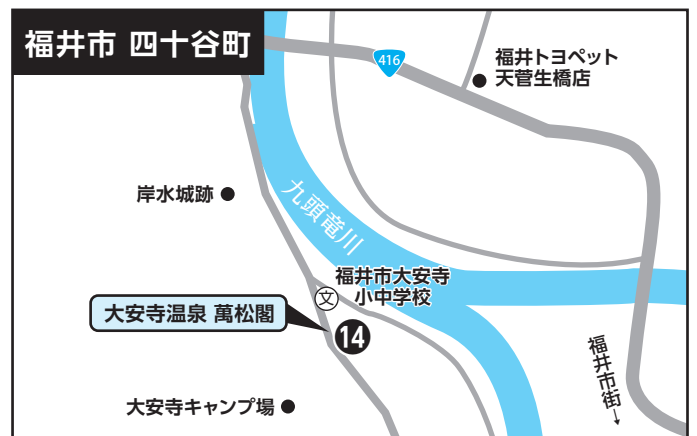
⑭ 大安寺温泉 萬松閣