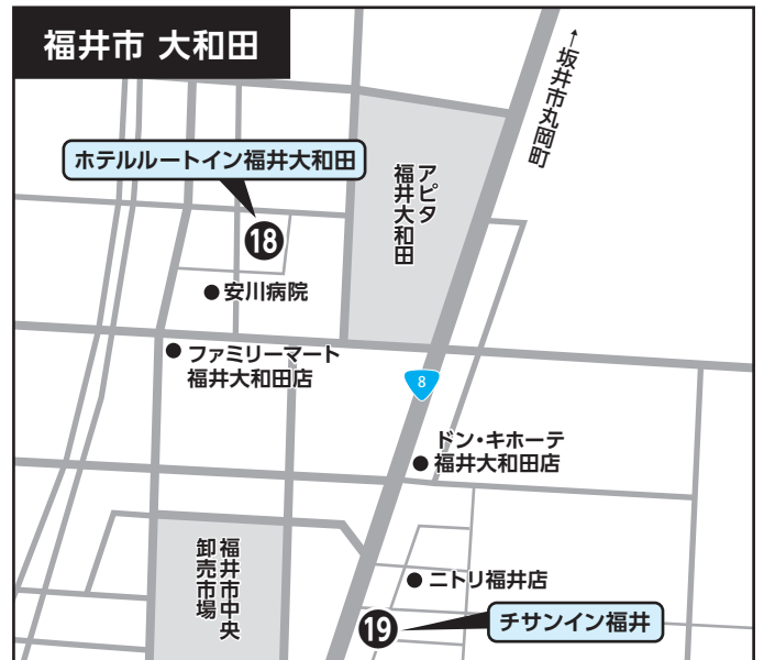
⑱ ホテルルートイン福井大和田 ⑲ チサンイン福井