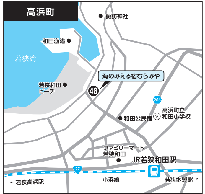
④⑧ 海のみえる宿むらみや