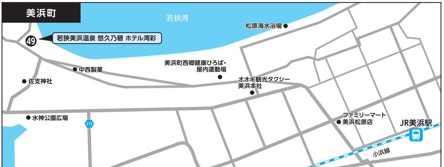
④⑨ 若狭美浜温泉 悠久乃碧 ホテル湾彩