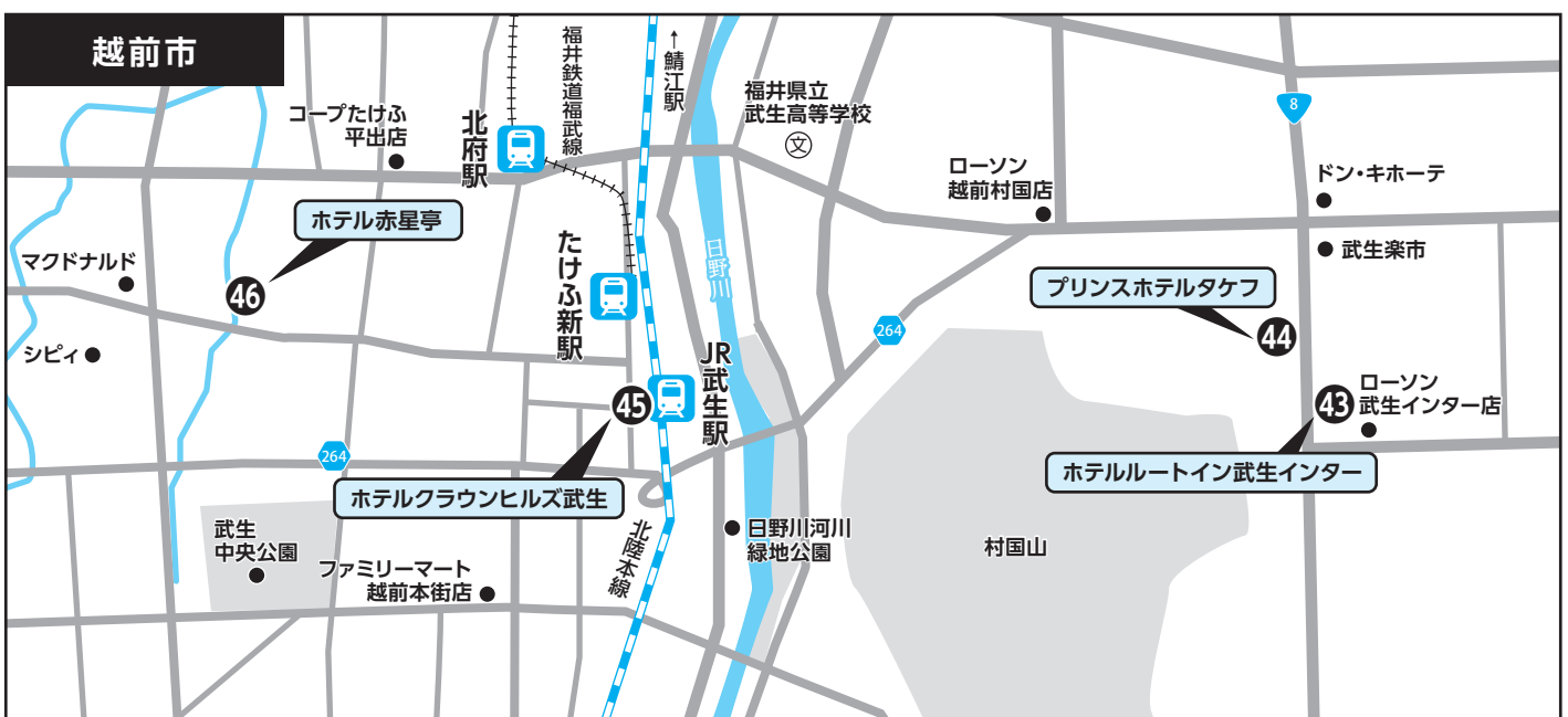
④③ ホテルルートイン武生インター