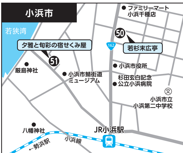
⑤⑩ 若杉末広亭 ⑤⑪ 夕雅と旬彩の宿せくみ屋