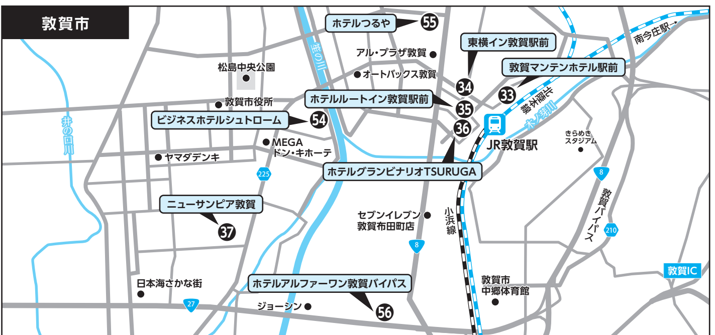
③③ 敦賀マンテンホテル駅前 ③④ 東横イン敦賀駅前 ③⑤ ホテルルートイン敦賀駅前 ③⑥ ホテルグランビナリオTSURUGA ③⑦ ニューサンピア敦賀 ③⑧ ビジネスホテルシュトローム ③⑨ ホテルつるや ③⑩ ホテルアルファワン敦賀バイパス