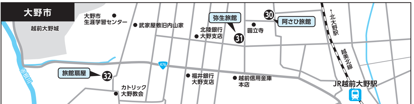
③⑩ 阿さひ旅館 ③⑪ 弥生旅館 ③⑫ 旅館扇屋