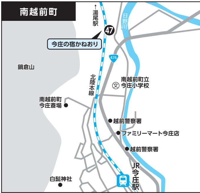
④⑦ 今庄の宿かねおり