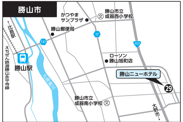
②⑨ 勝山ニューホテル