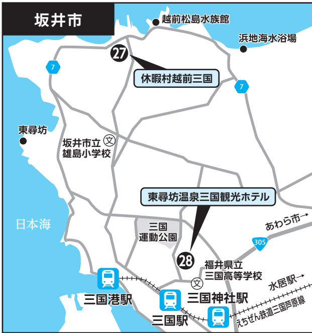
②⑦ 休暇村越前三国 ②⑧ 東尋坊温泉三国観光ホテル