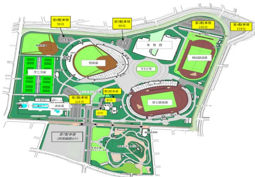
福井運動公園 駐車場配置図